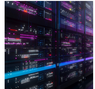
ハイパフォーマンス コンピューティングのシステム