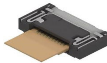
安定した嵌合とケーブル保持による位置の固定で脱落率を低減。