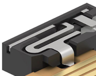
FFC/FPCケーブルをしっかりと固定する、左右両側に1つずつ配置されたロックネイル。